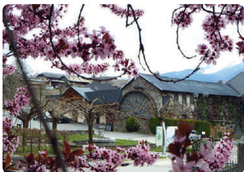
LA GRANDE ROUE