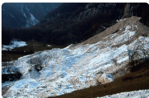
NÉVÉ DE PLAN CRUET