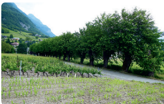
LE CHEMIN DES MÛRIERS