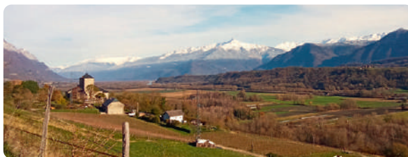
LE DOMAINE DU CHÂTEAU DE LA RIVE AVEC AU FOND LE GRAND ARC (2484 M)

Continuer sur D201 au hameau la Baraterie.