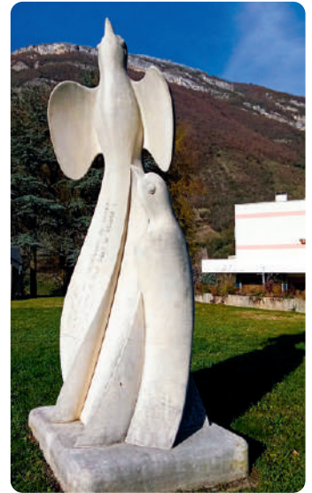
PLACE ALBERT SERRAZ

Centre administratif communal, Place Albert Serraz du nom du maire (1947-1977) et conseiller général (1949-1973).