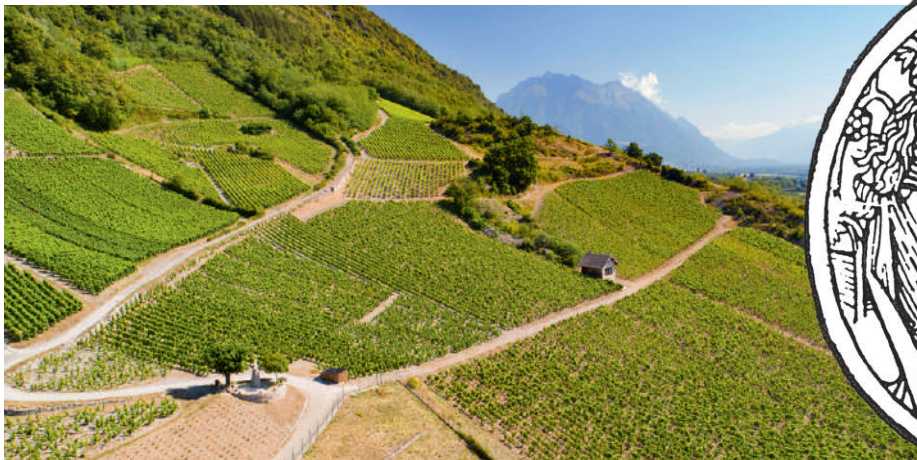
LE VIGNOBLE D'ARBIN

Ici, la vigne produit très bien et depuis très longtemps. Des auteurs tels que Pline et Columelle en font déjà état au 1 er siècle avant J.C. Depuis et jusqu'à notre époque contemporaine, ce fut la création puis, après les ravages du phylloxéra, la renaissance du vignoble savoyard par la mise en valeur des procédés de culture, la quête de la qualité. Ce terroir historique est donc un espace représentant la conjonction d'un sol, d'un climat donnant ainsi un caractère unique au raisin récolté et aussi du travail des vignerons gardiens du temple.