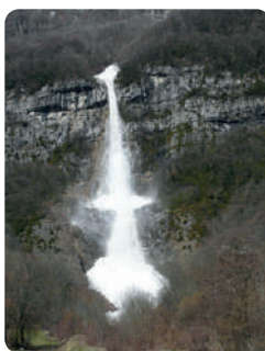
AVALANCHE DE PLAN CRUET