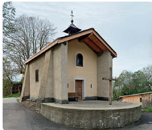
CHAPELLE NOTRE-DAME DES GRÂCES