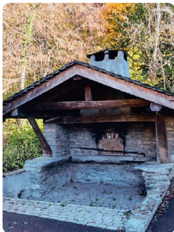
FOUR À PAIN

Bien située tout en haut du village, au bout de la route de La Chapelle, elle a été construite par les habitants que la peste de 1632 avait épargnés. Très bien restaurée, avec de belles peintures murales intérieures, elle abrite la statue d'une vierge dorée.