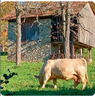
GRENIER AU VILLARD

A l'entrée du hameau une maison sur la gauche possède une grosse meule témoignant de l'ancienne activité des moulins dans la vallée. C'est le plus gros hameau de La Table après le chef-lieu. Il se tient sur la rive gauche du Gelon, du côté de l'envers. C'était autrefois le Villard, où se trouvaient granges et habitations du personnel, appartenant à un propriétaire de la Ville (chef-lieu). Une petite promenade à l'intérieur du hameau est intéressante (roues de moulin, grenier en bois dans un champ...).